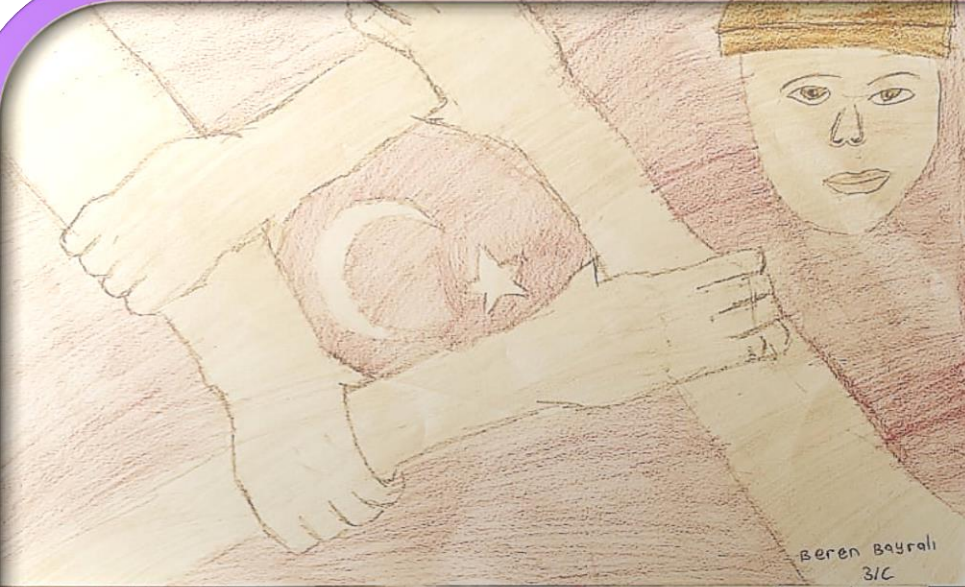
Beren Bayralı 3/C